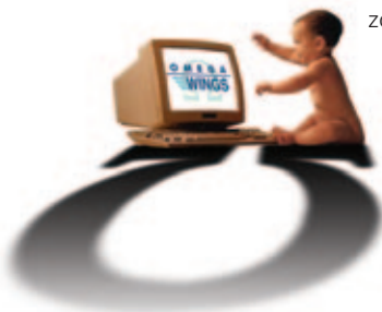
tabelle e archivi precaricati rendono l'azienda operativa fin da subito.

zo e successivi aggiornamenti seguono le consuete modalità standard degli ambienti Windows, agevolando il compito degli operatori. Grazie alla presenza di un utente "pronto all'uso",